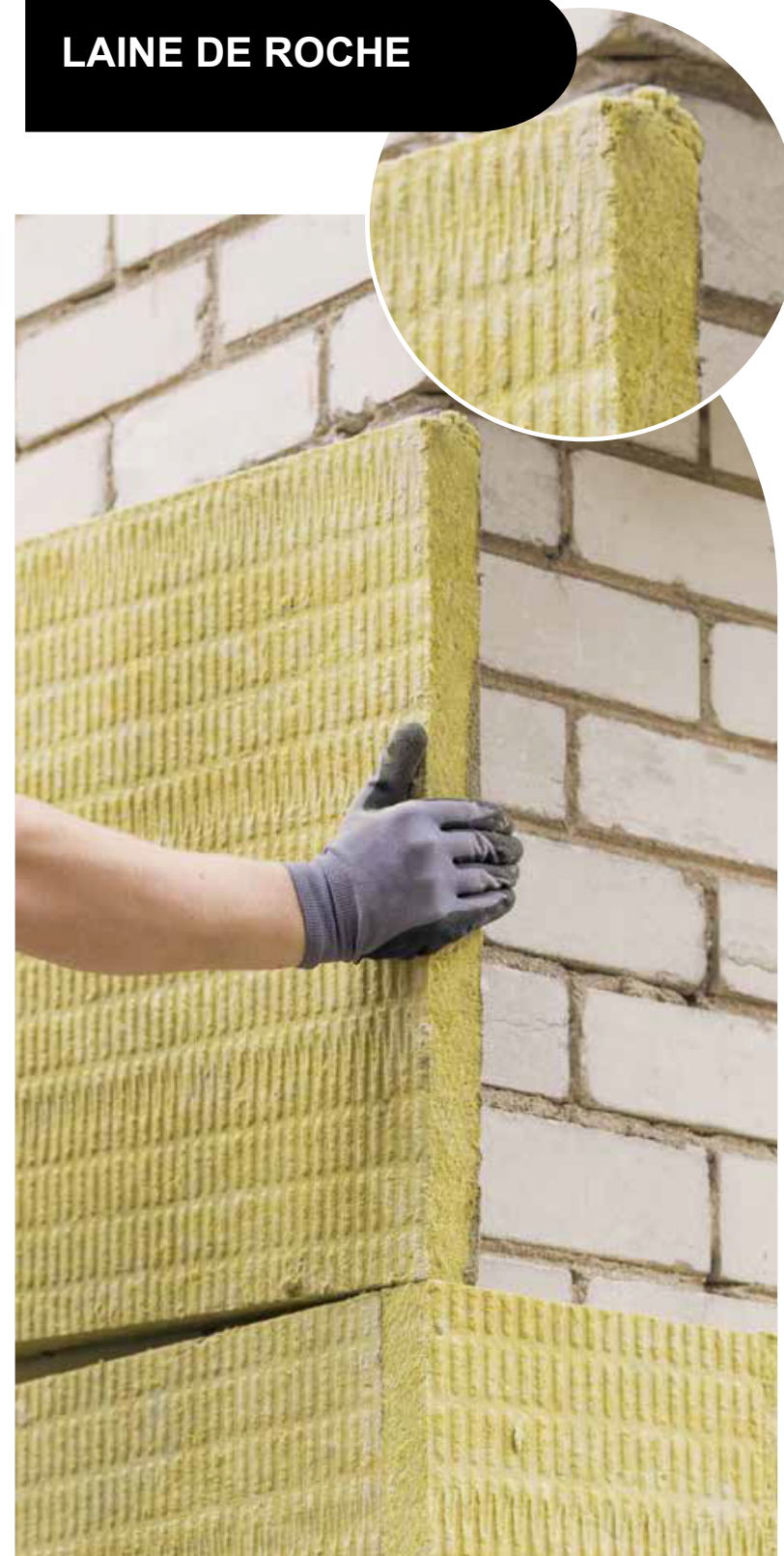
LAINE DE ROCHE